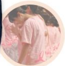
ピンクリボンプロジェクト