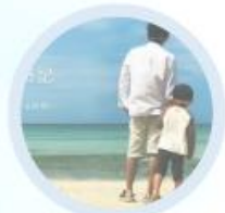
オンラインサロン